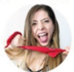
SHAYVISE 536k YouTube | 5,3M TikTok

Le concept : « J'ai testé le métier de ... » Page d'accueil de Ludovic B - YouTube Ludovic B - YouTube